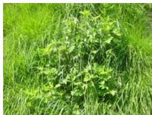
施工後 3 ヶ月

GZタイプ) 播種領域 1: 外来草本類 播種領域 2: 木本類(在来草本類含む)