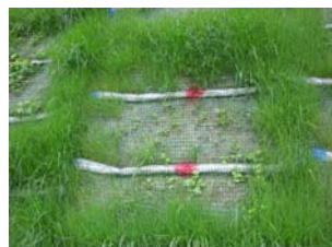
施工後 2 ヶ月