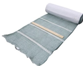
ログインマット P40 型