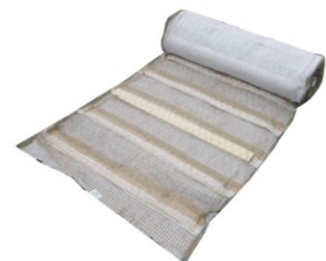
ログインマット 5A 型