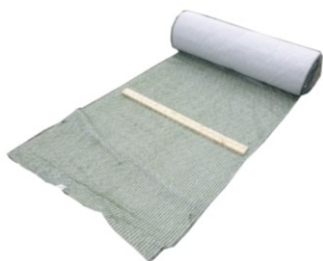
ログインマット シート型

植生マットには、亀甲金網と板材が取り付けられています。 丸太材は施工地周辺から調達し、植生マット設置後、板材の下に挿入します。