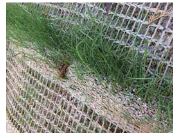
発芽開始 (早期に発芽)