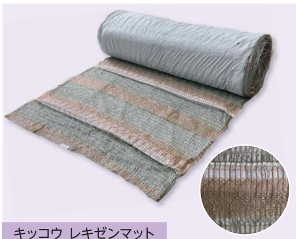
キッコウ レキゼンマット