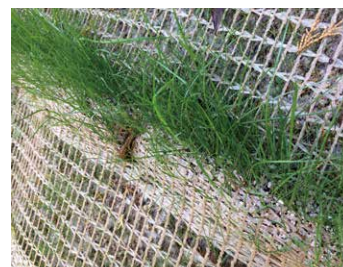
発芽開始 （早期に発芽）