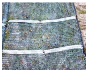
植生マット （肥料袋付）