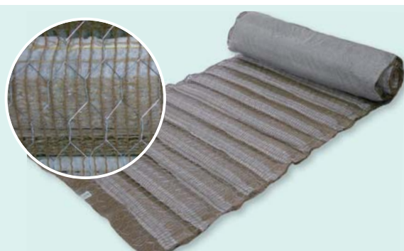
キッコウ ガンリョクマット