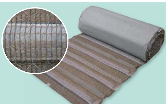
キッコウ イースターマット

日新産業の植生マットは、原則としてほぼ全てを亀甲金網付にすることができます。主なものを以下に示します。