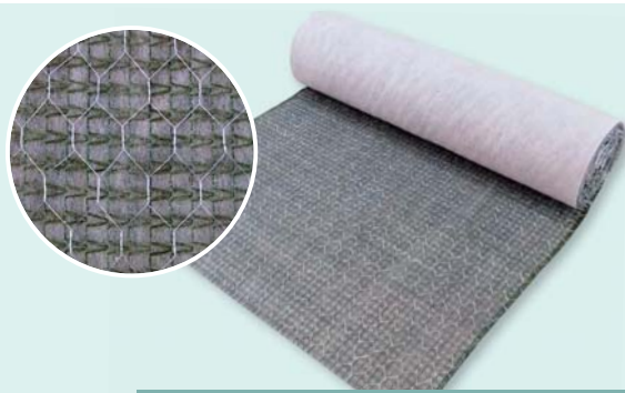
キッコウ ソイルテクター