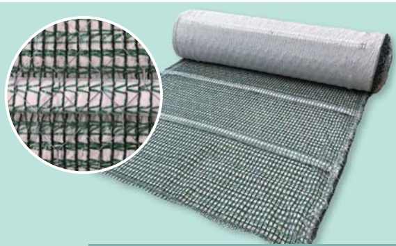
キッコウホルダー