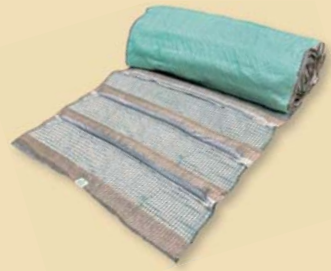
ガンリョクマット 5A型