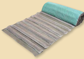
ガンリョクマット 5型