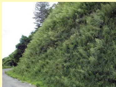
施工後 6 ヶ月