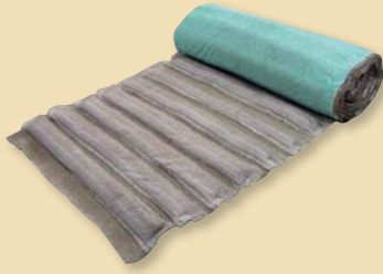
ガンリョクマット 6型