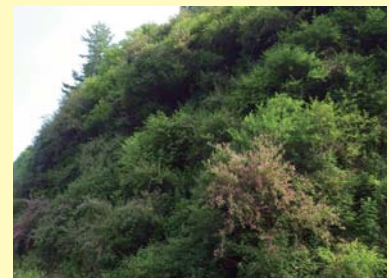
施工後 5年 4 ヶ月