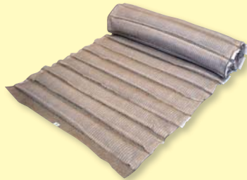
ガンリョクマット 2型