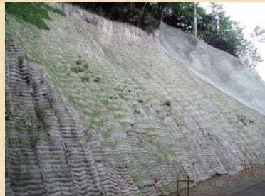
施工後 1 ヶ月