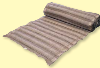
ガンリョクマット 1型