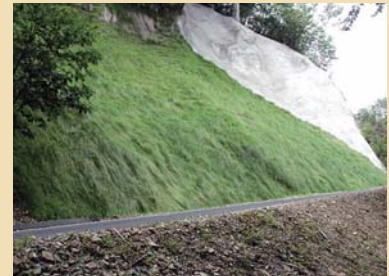
施工後 8 ヶ月