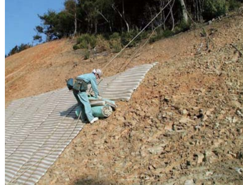
ガンリョクマット工