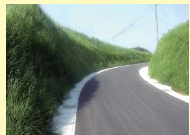
施工後 6 ヶ月