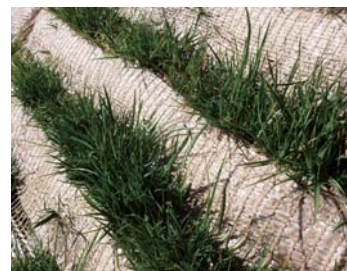
発芽開始 （早期に発芽）