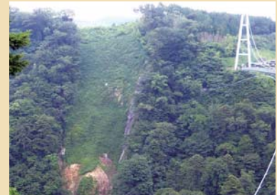
施工後 2年 4 ヶ月