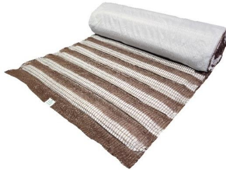
ガンリョクエコマット 6型