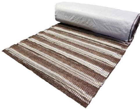
ガンリョクエコマット 5型