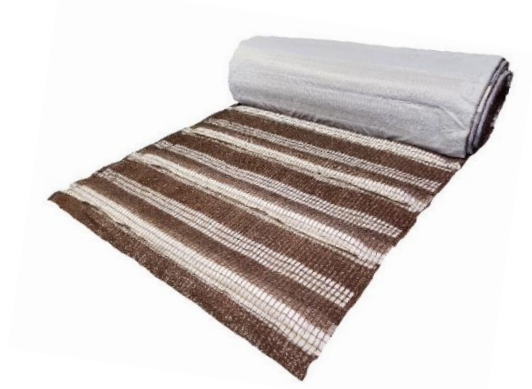
ガンリョクエコマット 5A型