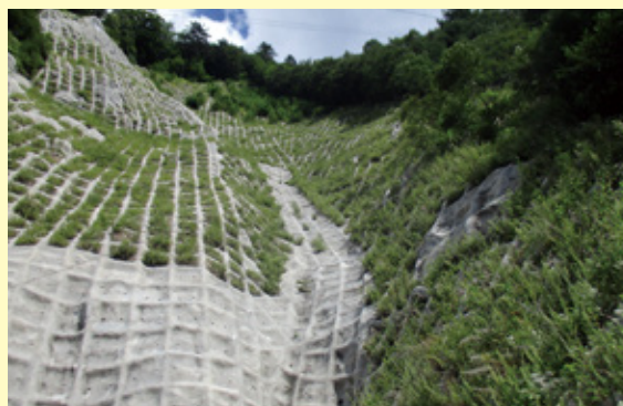
施工後 3 年 1 ヶ月