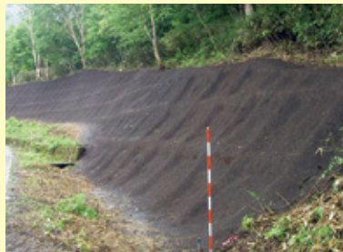
補強土植生法砕工 施工直後