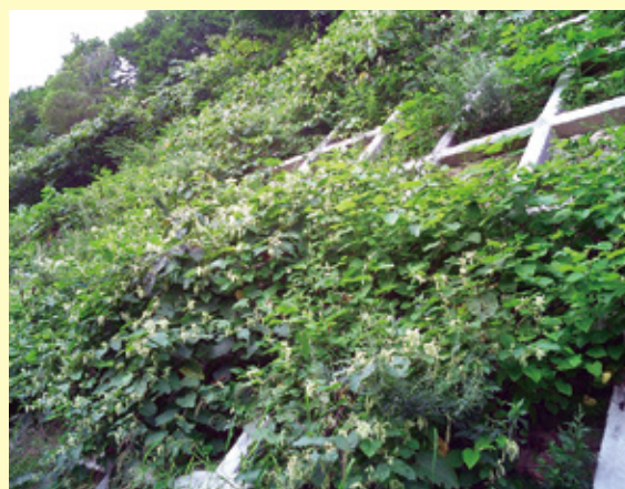
施工後 9 ヶ月