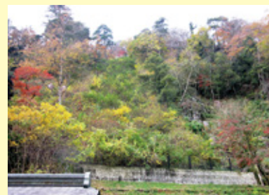
施工後 6 年 7 ヶ月