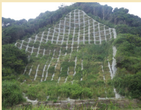
施工後 1 年 6 ヶ月