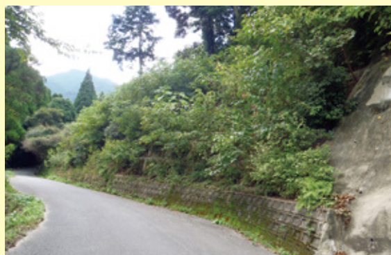
施工後 2 年 6 ヶ月