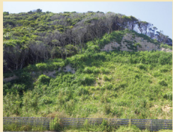
施工後 2 ヶ月