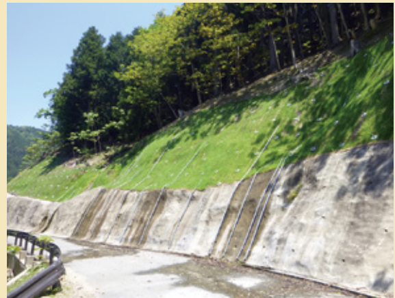
施工後 7 ヶ月