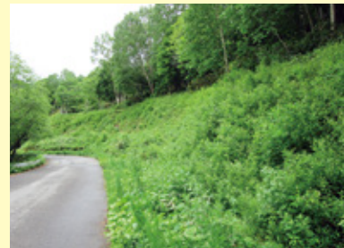
施工後 2 年 8 ヶ月