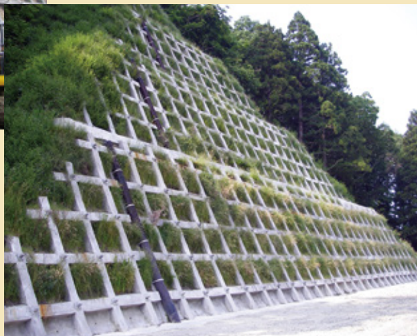
施工後 1 年