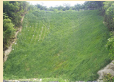
施工後 4 ヶ月