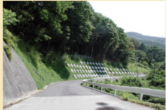
施工後 3 ヶ月