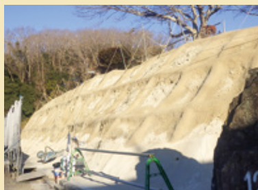
補強土植生法砕工 施工直後