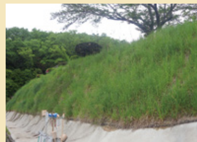
施工後 1 年 4 ヶ月