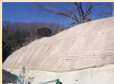
植生マット 施工直後