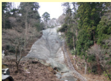
連続繊維複合補強工 施工直後