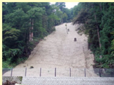
植生マット 施工直後