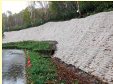
植生マット 施工直後