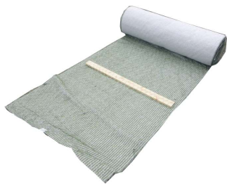
ログインマット シート型

植生マットには、亀甲金網と板材が取り付けられています。 丸太材は施工地周辺から調達し、植生マット設置後、板材の下に挿入します。