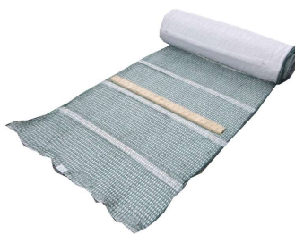
ログインマット P40 型