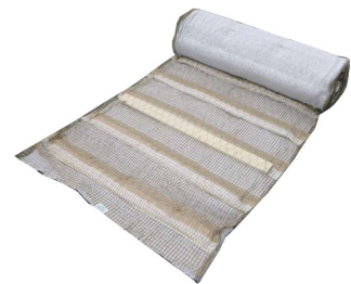
ログインマット 5A 型