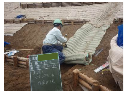
図 1. マット施工状況

そのためには、マットを一気に展開せず足で保持しながら、順次下流側方向に向かってアンカー類を打設するのが望ましい (図 1 参照)。また、地山の凹凸によりマットの浮き上がりが予想される箇所については、増し打ち等を行うのが望ましい。